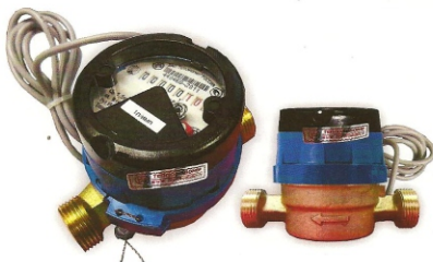
Рис.8 Счетчик холодной воды с магнитоуправляемым контактом ВСХд-15-02