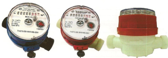
Рис.10 Счетчики холодной и горячей воды BCX-15-03; BCГ-15-03

Счетчики типа BCX, BCXd, BCГ, BCГд, BCТ DN 15 - 03 корпус изготовлен из высокопрочной пластмассы, имеют восьми - разрядный барабанный счетный механизм и один стрелочный индикатор (рис.10).