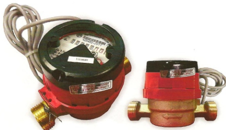
Рис.7 Счетчик горячей воды с магнитоуправляемым контактом ВСГд-15-02