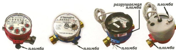
Рис.1 Схема пломбирования приборов от несанкционированного доступа

Счетный механизм крепится к корпусу при помощи пластикового прижимного кольца с ушком для опломбирования от несанкционированного вмешательства.