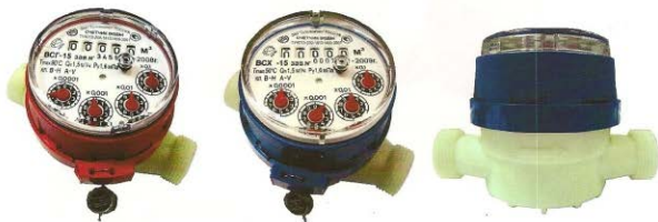
Рис.5 Счетчик горячей и холодной воды ВСГ-15-01, ВСХ-15-01

Счетчики типа ВСХ, ВСХд, ВСГ, ВСГд, ВСТ DN 15; 20 - 01 корпус изготовлен из высокопрочной пластмассы, имеют пяти - разрядный барабанный счетный механизм и четыре стрелочных индикатора (рис.5)