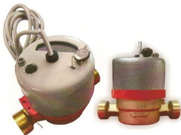
Рис.4 Счетчик горячей воды с магнитоуправляемым контактом ВСТ-15

Счетчики типа ВСХ, ВСХд, ВСГ, ВСГд, ВСТ DN 15; 20 - 01 корпус изготовлен из высокопрочной пластмассы, имеют пяти - разрядный барабанный счетный механизм и четыре стрелочных индикатора (рис.5)