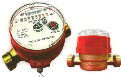
Рис.6 Счетчик горячей воды ВСГ-15-02